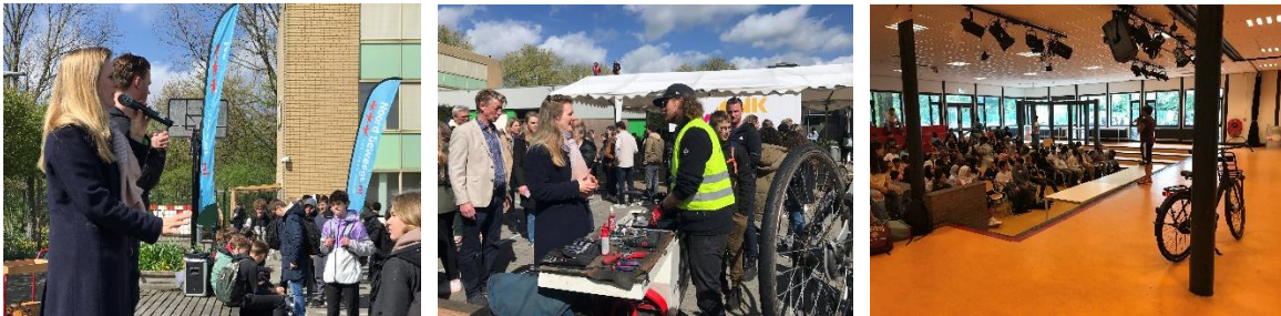
Kick-off voor leerlingen: op het schoolplein of in de aula

In het materialenpakket zit een informatiebrief voor ouders/verzorgers, een Powerpoint voor leerlingen, een basistekst voor op de website en ondersteunend beeldmateriaal.